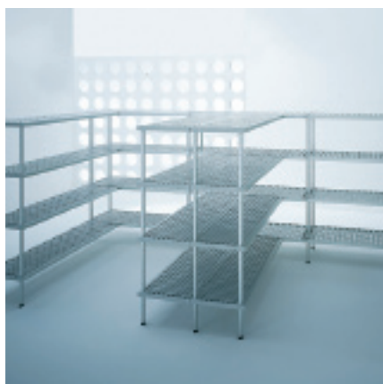
Composizione scaffalatura Shelving arrangement Regalkomposition Composition rayonnage

Controlled, preserved freshness Kontrollierte und konservierte Frische La fraîcheur contrôlée et conservée