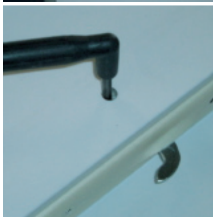
Sistema di aggancio pannelli Panel attachment system Panel-Einhaksystem Système d'accrochage des panneaux